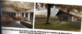
Intérieur et extérieur de la future salle de cérémonies du cimetière de Blancpignon (SALTA Collectif d'Architectes)

La végétation est parfaitement adaptée au recueillement des visiteurs, elle suppose ce genre de lieu. Les équipements existants seront mutualisés (parking, conciergerie, ...). Une salle de réception sera en cours de réalisation et viendra compléter l'ensemble. Elle répondra à la demande croissante des familles d'organiser des funérailles laïques et leur moment de recueillement auprès du défunt. Elle se situera à l'entrée du cimetière et proposera aussi un caveau provisoire (8 places). Les travaux de construction s'achèveront au printemps 2022.